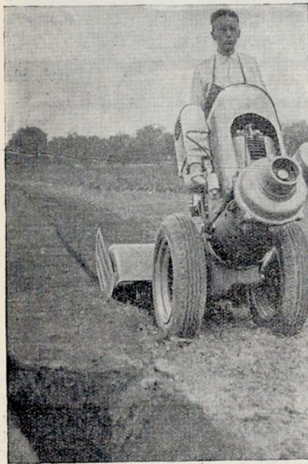
4 Gang 8 PS Bodenfräse Abb. 4

kultur konstruierten Landwirtschaftstraktor besteht mit dem eine Ackerfräse von 1,80 m. Arbeitsbreite verbunden ist. (Abb. 1.)