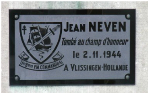
Die Gedenktafel im Diekircher Friedhof