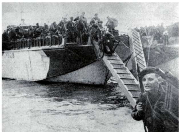
Landungsboot der „Fusiliers Marins“

Der Vorfall bestätigt, was Antony Beevor über den extremen Fanatismus der SS-Einheiten schreibt, die es vorzogen,