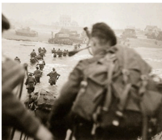
Landung der „Fusiliers Marins“

Impakt der Explosion erleidet, während der Auslöser eventuell glimpflicher davongekommt.“ In seinem Buch „D-Day et la bataille de Normandie“ beschreibt Antony Beevor den Einsatz des Kommandos folgendermaßen: