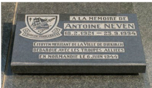
Die Gedenktafel im Museum von Ouistreham