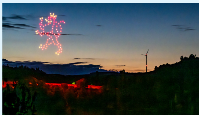
Premier spectacle de drones à Diekirch la veille de la fête nationale 2024.